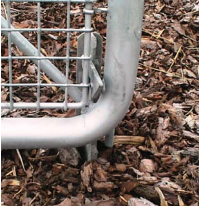
Gliphage til fasthold i åben position.