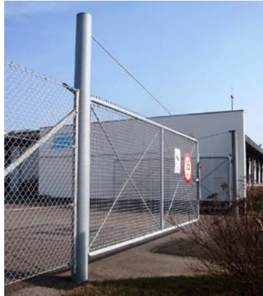
Forhøjet stolpe til bardun (store rammer).